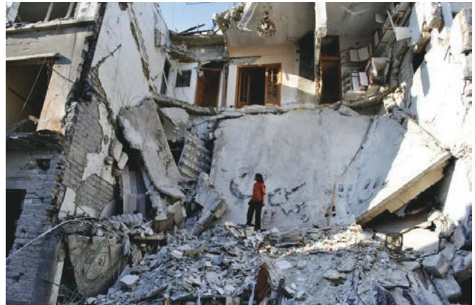
EAU ARGENTÉE, SYRIE AUTO PORTRAIT d'Oussama Mohammad et Wiam Simav Bedirxan

Sur les décombres d'un monde violenté, Eau argentée, Syrie autoportrait aspire à un retour du langage qui saurait à nouveau décliner la couleur de la vie, le goût du sable, la beauté des liens fraternels : « Enseigne-moi humain en Kurde », murmure Havaló. « Mirov », répond Simav, au bout du voyage. Un voyage infernal sous tension, qui fait se côtoyer l'abjection des bourreaux (un jeune homme torturé, humilié) et l'innocence des victimes (un bébé venant au monde, des animaux sacrifiés). Un voyage qui par sa forme même tente l'impossible raccord entre la naissance et la mort. Champ et contrechamp : Yassim et Mariam, deux enfants plein de vie filmés par Simav/Mariam et Yassim, les mêmes enfants figés dans la mort, leurs petits corps inversés à