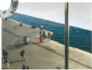
JOURNEY TO THE WEST TSAÏ MING-LIANG