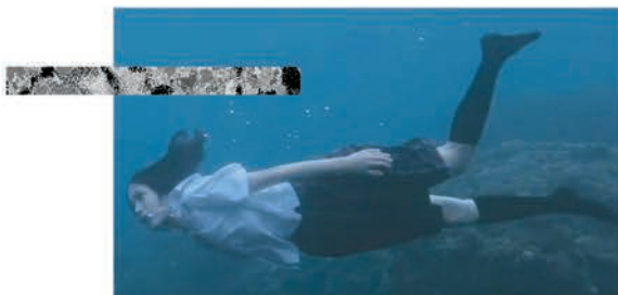
STILL THE WATER NAOMI KAWASE