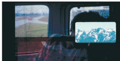
LE JOUR NOUS ÉCOUTE FÉLIX DUFOUR-LAPERRIÈRE