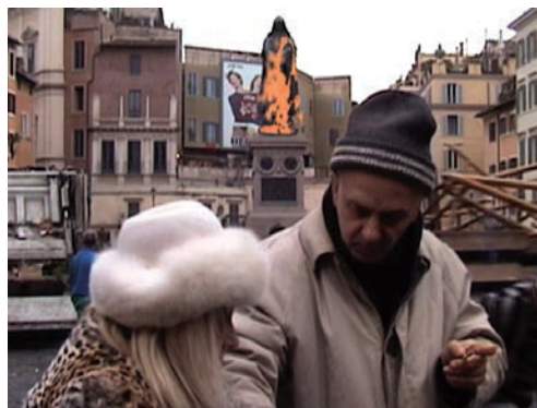
LA STATUE DE GIORDANO BRUNO (2005)

En même temps, l'expérience de La plante humaine , que j'ai réalisé à l'ONF en 1996, n'avait pas été si différente de celle de 49 Flies , puisque ça avait donné lieu à trois ou quatre ans de performances avec des musiciens, ce qui m'avait fait accumuler de la matière. Je devais probablement, à l'époque, être une sorte d'alibi expérimental pour la boîte, parce que ça faisait bien de dire que cette tradition-là subsistait. Mais il y avait quand même, ultimement, l'obligation de réaliser un film. C'est sûr que lorsque j'obtiens une bourse du Conseil des arts, c'est la même chose. Si je décide de faire une demande, c'est que je sais qu'un film va exister. Par contre, Seule la main et 49 Flies n'ont bénéficié que de bourses de déplacement occasionnelles. Il y a aussi le cas de cet étrange projet, Triptyque , qui est certainement la réalisation la plus radicale que j'ai faite : un film abstrait de 30 minutes issu d'une série de performances d'atelier. Personne n'a voulu le montrer parce que ça ne cadre nulle part! Sauf à l'occasion de présentations assez confidentielles (devant des petits publics) au FNC et aux Rendez-vous du cinéma québécois, je l'ai essentiellement présenté lors de rencontres avec des étudiants. L'œuvre demande effectivement des explications car ce projet s'est développé autour de l'idée d'une petite machine formelle qui a eu beaucoup d'importance pour la