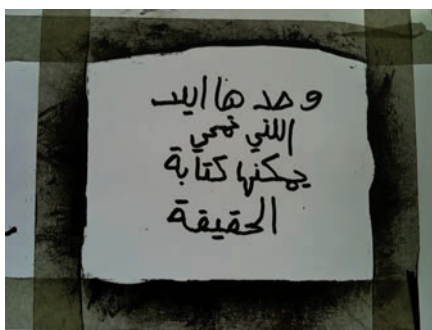
SEULE LA MAIN