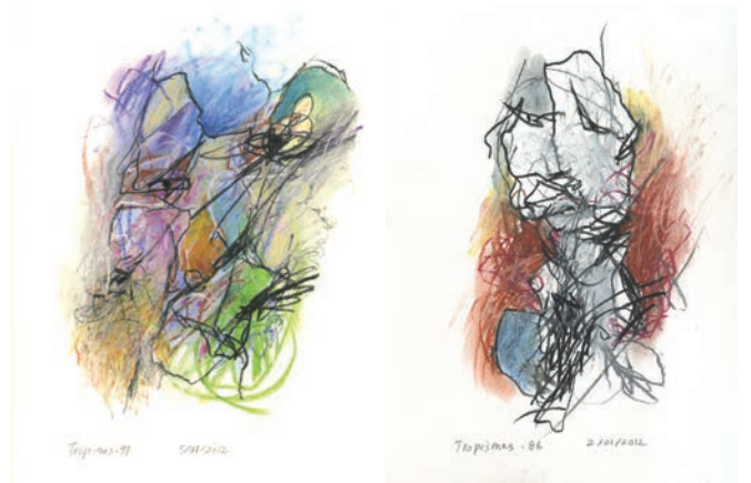
Deux dessins de la série « Tropismes »

L'installation est basée sur quatre boucles de durée différentes jouant sur quatre écrans. J'ai rapidement su que la différence de longueur entre chaque boucle devait être assez importante, soit au moins une minute de façon à ce que la recombinaison soit, elle aussi, importante à chaque répétition. Cela permettait qu'au-delà des 40 minutes de matériel réparties sur quatre écrans, et même si après treize minutes on a tout vu au moins une fois, il continue à y avoir des surprises dans la rencontre des différents segments et dans cette réorganisation organique de la matière. Les interventions typographiques, les passages au noir, les dessins,