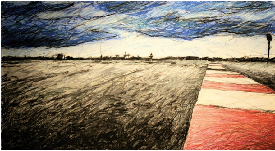
Image tirée du segment de l'aéroport Tempelhof de BERLIN – LE PASSAGE DU TEMPS

que deux mouches ensemble. Elles étaient toutes enregistrées séparément. C'est un travail qui est allé beaucoup plus loin que je m'attendais. C'est devenu presque musical comme construction.