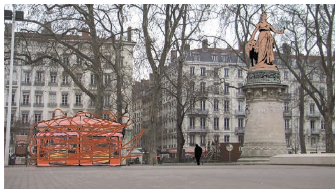
PLACE CARNOT-LYON (2011)

J'ai tourné au Mexique au moment de «la fin du monde», selon le calendrier Maya. Je voulais aller filmer le lever du soleil ce matin-là – même si je savais que c'était une raison futile! – et ce qui est arrivé, c'est que, non seulement il pleuvait à boire debout... donc impossible de tourner le lever du soleil... mais aussi qu'après sept ans d'invisibilité, les Zapatistes sont alors sortis de leurs villages. J'ai filmé à l'entrée de la ville de Palenque où il y avait un convoi de Zapatistes vraiment impressionnant, tous cagoulés et portant leur drapeau. Ce convoi était entouré par l'armée.