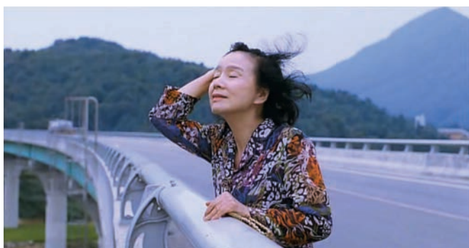
Daniel Day-Lewis dans THERE WILL BE BLOOD , Adèle exarchopoulos dans LA VIE D'ADELE d'Abdellatif Kechiche et Yoon Jeong-hee dans POETRY de Bong Joon-ho