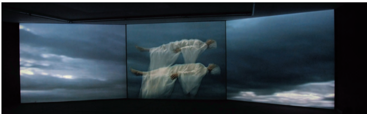
INVISIBLE PLACES – THE VAST WHITE (2008) de Marianne Strapatsakis