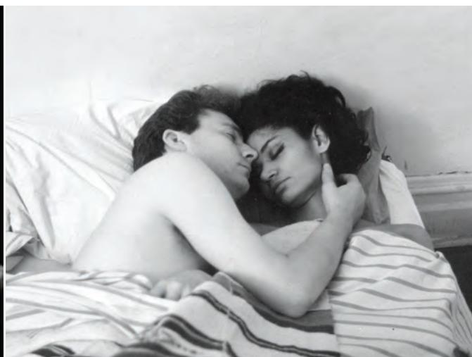
LE CHAT DANS LE SAC et À TOUT PRENDRE

CLAUDE JUTRA ET GILLES GROULX ONT RÉALISÉ, AU DÉBUT DES ANNÉES 1960, À TOUT PRENDRE ET LE CHAT DANS LE SAC , deux œuvres de fiction venues ébranler le conformisme qui pesait jusqu'alors sur notre cinéma. Et si nous envisagions ce qu'ils nous ont offert moins comme un héritage à idolâtrer que comme un rêve de liberté et d'ouverture à faire fructifier ? Que reste-t-il en fait aujourd'hui de ce que ces deux cinéastes avaient espéré voir surgir dans et par les films que nous réalisons ? De quelle manière avons-nous répondu à ce désir de représenter une société québécoise déjà plurielle qui s'exprimait alors pour la première fois avec autant de clarté à l'écran ?