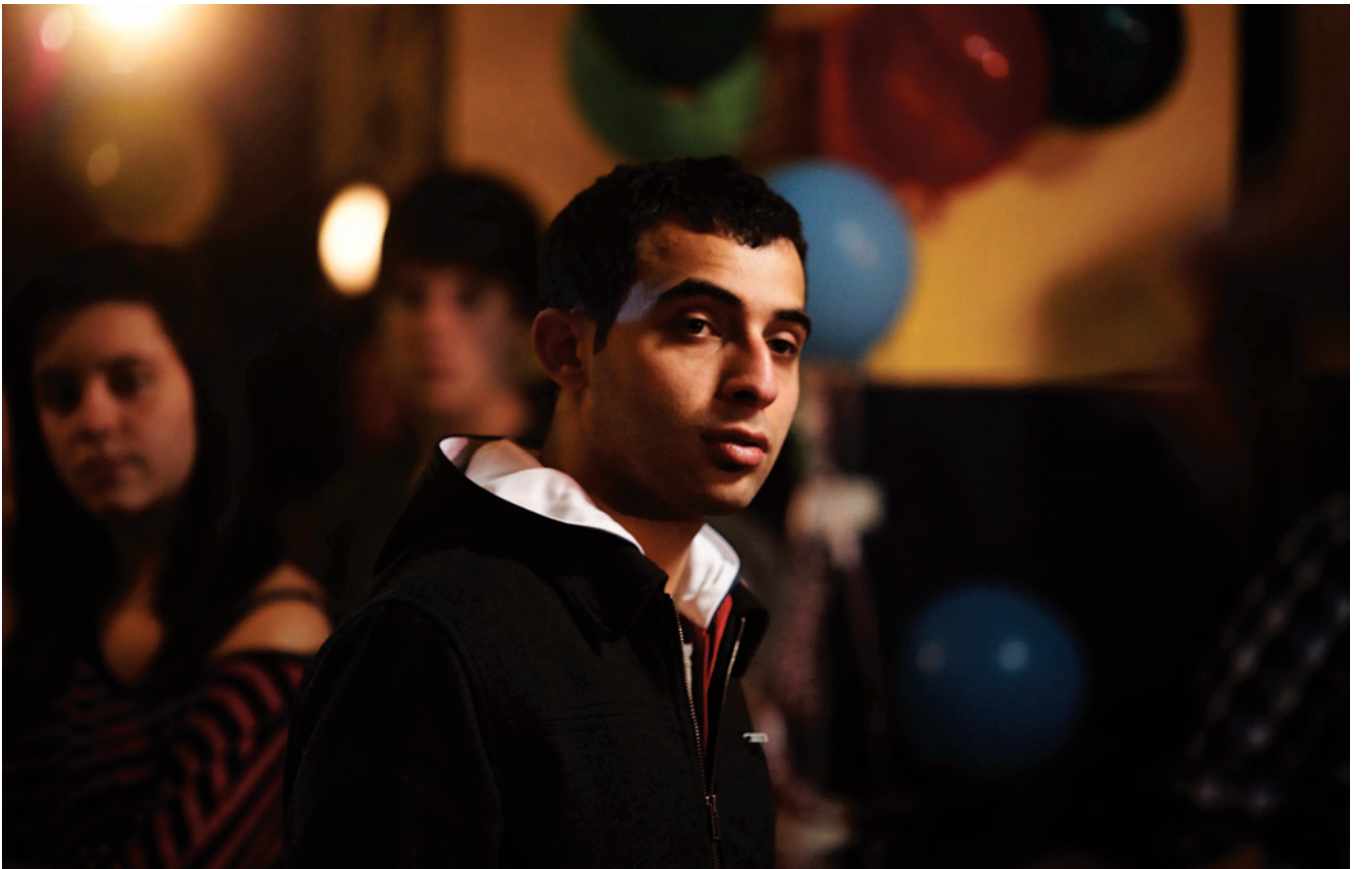
ROMÉO ONZE d'Ivan Grbovic