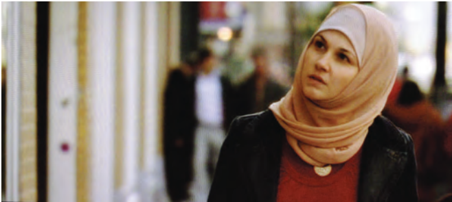
SUZIE de Micheline Lanctôt

mis à mal par une méprise (Fanny jette Traore à la rue lorsqu'elle apprend qu'il lui a caché avoir été licencié). Car dans ce film, la chute du personnage repose, d'une part, sur le fait qu'il a pris la parole pour dénoncer un manquement grave de la compagnie de navigation dont il avait été témoin et qui est en cause dans l'avarie qui immobilise le cargo et, d'autre part, sur le fait qu'il se soit tu face à Fanny au sujet des manigances politiques dont il est victime, laissant ainsi la place aux ouï-dire. Mais ce silence qu'il garde avec Fanny est le contraire d'un retrait hors du langage que l'on retrouve chez tant de personnages de notre cinéma; ce n'est pas le silence de l'impuissance, d'une désaffection face au monde, mais celui