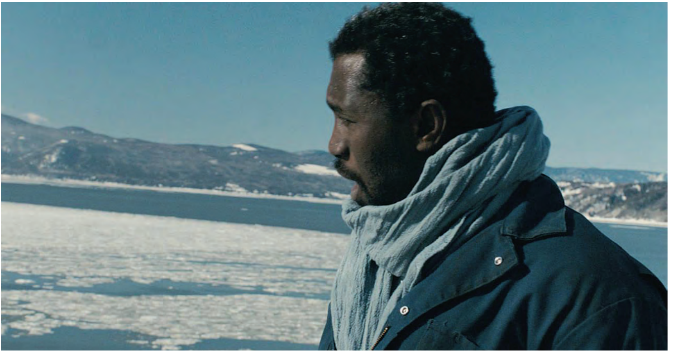
DIEGO STAR de Frédérick Pelletier