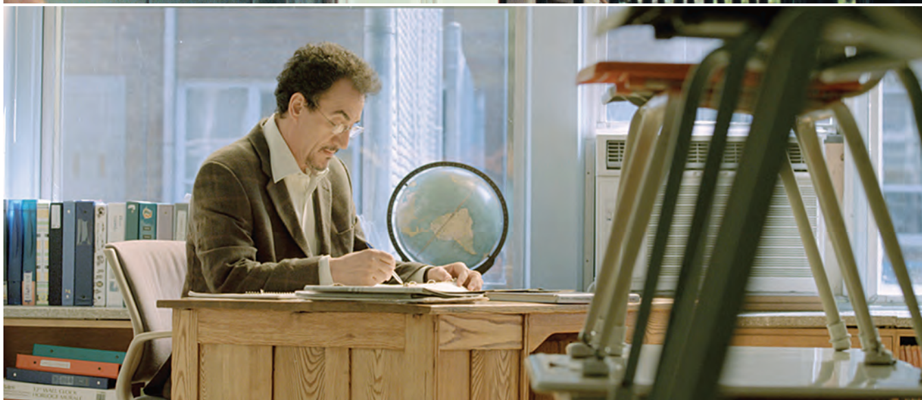
LAURENTIE de Mathieu Denis et Simon Lavoie et MONSIEUR LAZHAR de Philippe Falardeau

Et cette nouvelle standardisation routinière qui s'est réinstallée dans le cinéma québécois n'est certainement pas totalement étrangère à ce terrible principe de « gouvernance » globale qui s'est étendu à toute la société. Ce qu'on constate, c'est qu'en cinquante ans, notre cinéma a plutôt suivi le chemin parcouru par Jutra que celui de Groulx. Alors que Le chat dans le sac , bien que perçu comme « révolutionnaire » à l'époque, apparaît aujourd'hui davantage comme l'amorce de ce que le cinéaste allait pousser beaucoup plus loin par la suite, Jutra, quant à lui, a signé avec À tout prendre son film le plus radicalement libre et inventif, pour ensuite se diriger vers un classicisme plus normatif avec des films comme Mon oncle Antoine et Kamouraska . Il est clair qu'après