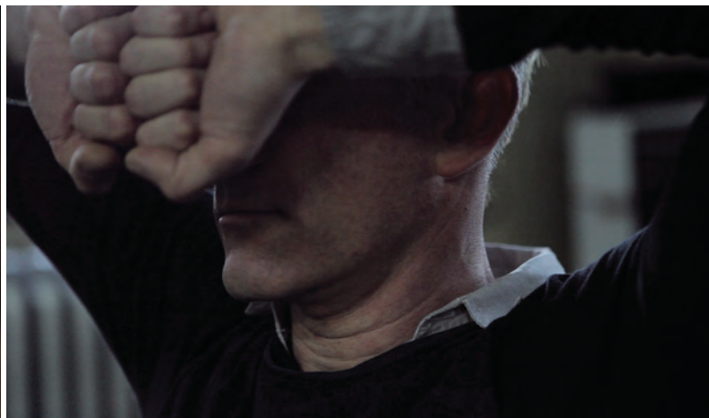
Deux épisodes du collectif ÉPOPÉE