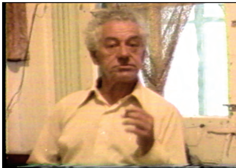
LE VOLEUR VIT EN ENFER de Robert Morin

« L'indépendance, ça tient à quoi? Ça tient au fait que tu veux aller au bout d'une idée de la production, mais vraiment au bout, avec les moyens requis pour aller jusqu'au bout, sans que personne n'intervienne pour te dire: "Tu devrais pas faire ça comme ça"... ou "tu devrais pas dire ça". À la limite, c'est ça l'indépendance, le reste on s'en fout. » ■