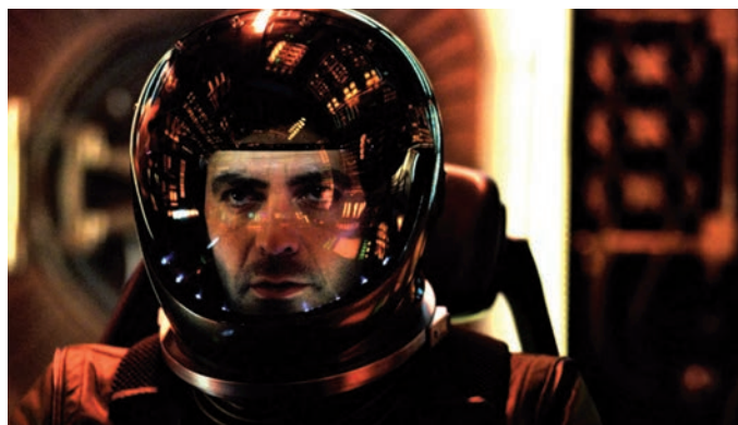
GRAVITY (2013) d'Alfonso Cuarón – Film d'ouverture de la Mostra de Venise cette année.

FORCE EST D'ADMETTRE QU'AU-DELÀ DE QUELQUES NOMS ÉTABLIS (QUENTIN TARANTINO, JOEL ET ETHAN COEN), de deux jeunes cinéastes habitués du circuit des festivals (Bong Joon-ho, Hitoshi Matsumoto) et d'un auteur dont l'œuvre en dépasse depuis longtemps les carcans (Kyoshi Kurosawa), le cinéma de genre s'avère le grand oublié de cet exercice visant à brosser, à défaut d'une liste exhaustive et définitive, un certain portrait du cinéma contemporain. Faut-il y voir le signe d'un quelconque épuisement? Bien au contraire, on serait tenté de dire que le genre se porte bien et que, dans l'ensemble, ce cinéma qui depuis toujours entretient avec la critique une relation houleuse jouit en fait d'une légitimité nouvelle.