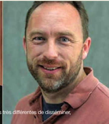
deux sourires et deux volontés très différentes de disséminer,