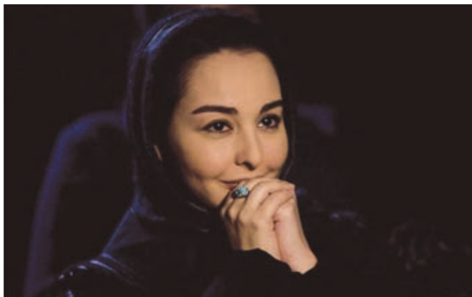
TEN et SHIRIN d'Abbas Kiarostami, tournés en numérique.

besoin de cette dose de réalité, de ce lien photographique avec le monde réel.