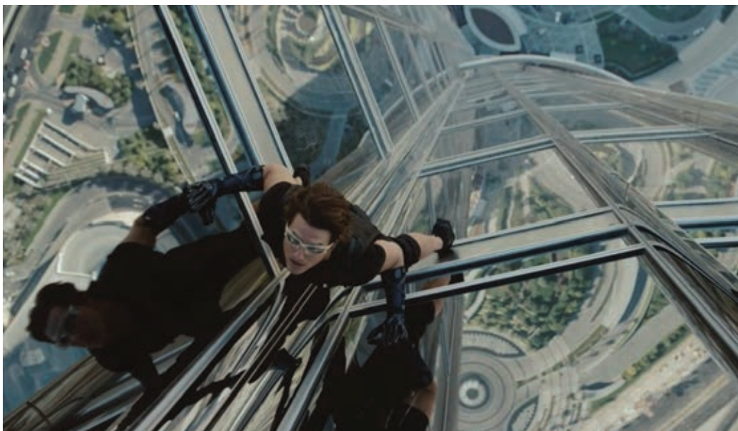
La cascade réelle de Tom Cruise dans MISSION : IMPOSSIBLE – GHOST PROTOCOL

Il y a quelques années, George Lucas a dit quelque chose d'intéressant dans le documentaire de Martin Scorsese, A Personal Journey Through American Cinema : « le cinéma était de la photographie. Maintenant, c'est de la peinture ». Cette remarque avait un double sens : non seulement le cinéaste peut désormais filmer ce qu'il a dans la tête en faisant fi du monde physique, mais il peut aussi, tout comme le peintre sur sa toile, revenir sans cesse pour ajuster ses images. Tout cela représente un formidable progrès, et les cinéastes obsédés de contrôle n'ont jamais eu autant d'outils pour s'assurer