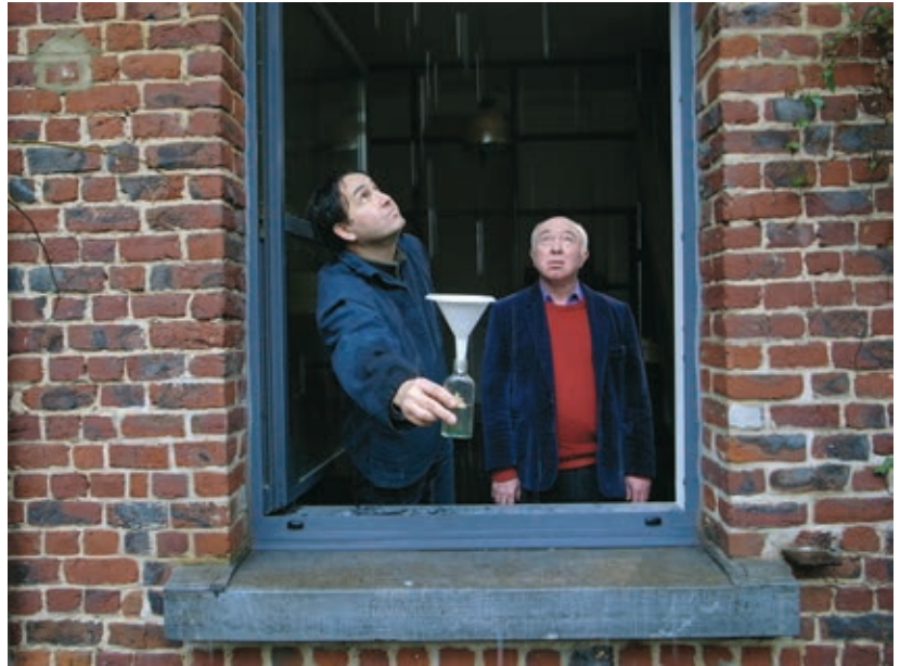
EXERCICES DE DISPARITION (2011)