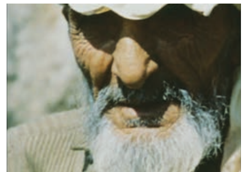
MÉDITERRANÉE (1963) de Jean-Daniel Pollet