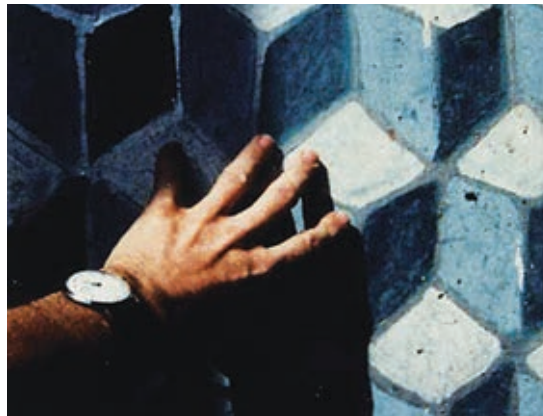
« IL EST DIFFICILE DE TOUCHER LE RÉEL. » En bas : VERS LE SUD.

fertile d'images pour parler autant de la violence du monde dont l'œuvre de l'artiste est totalement pénétrée que de l'exubérance de la vie. Les films de van der Keuken mettent en présence des éléments de natures diverses mais sans réduire les différences, sans estomper ce qui sépare, en faisant du choc cela même qui unit en rappelant que ces visages, ces voix, ces présences, ces matières réunis dans le temps et l'espace d'un film appartiennent aussi au même monde.