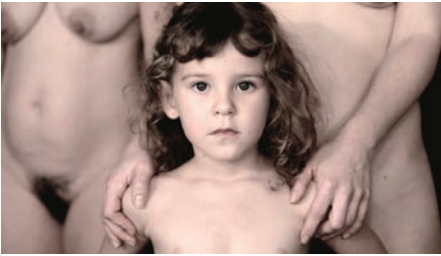
Ces femmes qui marchent de Yoakim Bélanger