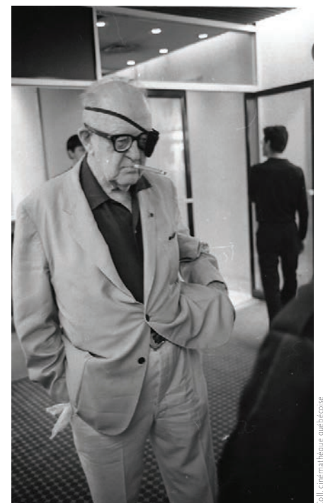
Fritz Lang à Montréal en 1967.