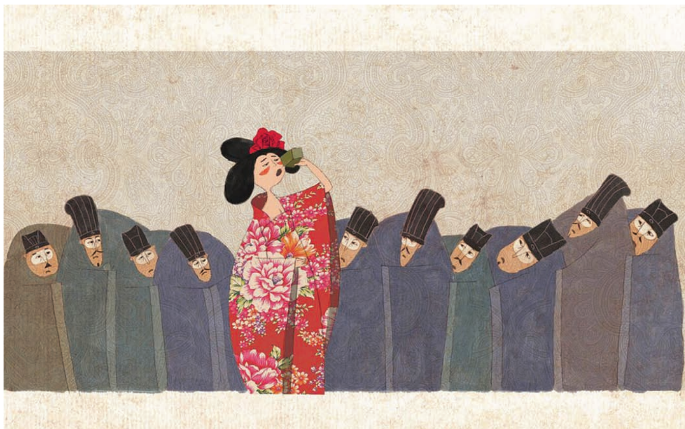
Le banquet de la concubine (2012) d'Hefang Wei