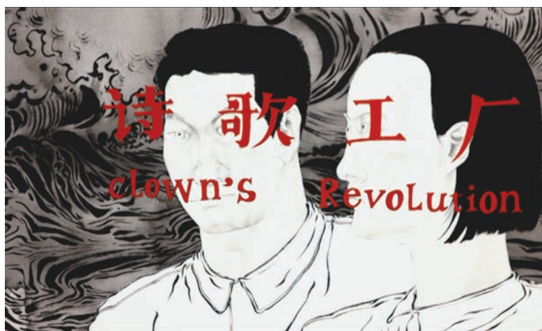
Clown's Revolution (2010) de Sun Xun

À ces films dont l'existence est accréditée par les festivals ou les musées s'en ajoutent d'autres, au profil plus clandestin, qui surgissent sur Internet et révèlent une position contestataire et provocatrice. C'est ainsi qu'en janvier 2011, sur YouTube ( http://youtu.be/rnw5B-vxSDmM ), apparaît un film d'environ quatre minutes dans lequel, sur une trame de rock heavy metal, des lapereaux sont empoisonnés par du lait contaminé, des centaines d'autres lapins sont brûlés dans un incendie, un vieillard est écrasé sous les roues d'un camion, etc. Toutes ces péripéties renvoient à divers incidents récents ayant marqué