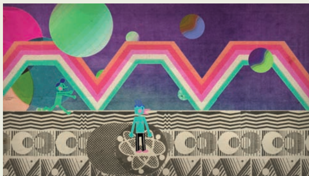
My... My... (2011)