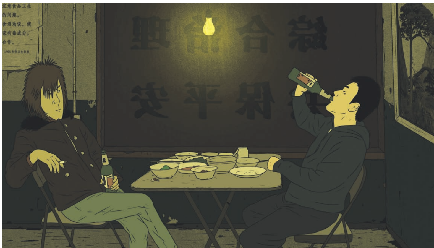
Piercing 1 (2009) de Liu Jian

En 2008, la Cinémathèque québécoise consacrait une séance au cinéma d'animation chinois contemporain. Fait révélateur, 10 des 14 courts métrages alors programmés étaient des films étudiants, un onzième, Pan Tian Shou (2003) de Joe Chang, ayant été réalisé par un Sino-Canadien installé à Hangzhou pour prendre la direction du département d'animation de la China Art Academy. Du groupe