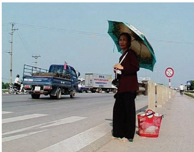
La terre des âmes errantes (1999)

Dans S21 , c'est le bourreau qui m'a montré la voie pour ce travail-là. Ce mec était incapable de parler. Je commence donc à le filmer et là, je lui dis : « Attends, prends ton temps. Ce n'est qu'une machine. Tiens, prends la caméra ». J'ai senti chez lui une vraie douleur, le besoin de dire et, en même temps, il revivait une profonde terreur qui le paralysait. C'était une souffrance incroyable. Du coup, je lui ai fait une suggestion : « Tu peux faire des gestes si tu veux. Si tu n'arrives pas à dire, tu me montres ». Et là, tilt! Après coup, il a été saisi d'une fièvre. C'était étrange. J'avais tellement peur pour cette séquence. J'avais invité deux personnes étrangères au film, chose que je ne fais jamais d'habitude. J'avais peur qu'on dise que c'est moi qui ordonnais, je ne sais pas. Il y avait Nath, les autres gardiens et ces deux personnes. Et après, il a fallu le soigner, le gars. Il a eu une poussée de fièvre. C'était comme une sorte d'exorcisme.