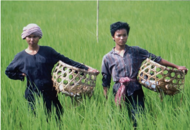
Les gens de la rizière (1992)

ne naît assassin. Tous les pauvres ne sont pas assassins. Maintenant on peut bien sûr se poser la question du mal et du bien. Le mal est toujours là, en nous. Mais même pauvre, on a la capacité de vaincre le mal. C'est comme ça que la civilisation continue. Le bien est toujours obtenu dans la souffrance. Ça n'a jamais été un cadeau de Dieu. Le bien est une œuvre de l'homme. Chaque jour est un combat. Et il faut que le cinéma épouse cette trajectoire. Je préfère arpenter un territoire qui est en ruine et poser des petits points de repère, ici et là.