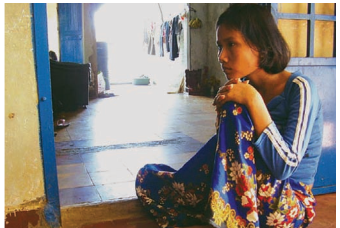
Le papier ne peut pas envelopper la braise (2007)

Oui, c'est une réécriture. Il faut connaître ses rushes par cœur. Si on a posé la même question une vingtaine de fois à différents moments du film, il faut voir comment la réponse a évolué. Bien sûr, on jette beaucoup, mais on voit très vite. Pour S21 , je cherchais les recoupements pour être sûr des faits. C'était le plus gros du boulot. Pendant le tournage, je passais mon temps à lire des confessions et là – quand je vous dis que je crois presque religieusement que les morts ne veulent pas mourir pour rien –, c'est étonnant... en lisant, je tombais sur des choses qui disqualifiaient soudain un témoignage antérieur. Pourquoi maintenant? C'est un grand mystère. Il y avait un gars notamment – je ne comprenais pas comment il avait pu rester interrogateur à S21 pendant presque trois ans – qui était dans un groupe que je qualifierais de « léger ». Je trouvais ça bizarre : en principe, l'expérience nous fait évoluer. Et un jour, je suis tombé sur un document qui prouvait qu'il était en fait dans le pire groupe. Je l'ai affronté. Et il a fallu tout recommencer à zéro et tourner à