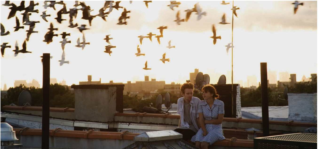
The Exploding Girl (2009) de Bradley Rust Gray

DANS LA MARÉE DE FILMS INDÉPENDANTS PRODUITS CHAQUE ANNÉE AUX ÉTATS-UNIS, ON ASSISTE DEPUIS environ une décennie à la naissance d'un sous-genre de films à très petits budgets, réputés comme trop «indies» pour Sundance et dont la circulation est liée de très près aux réseaux sociaux et aux plateformes de diffusion sur Internet : le mumblecore . Cette appellation ne fait pourtant pas l'unanimité au sein de l'industrie. Si de nombreux observateurs ont postulé l'existence d'une nouvelle vague cinématographique, plusieurs réalisateurs refusent d'emblée cette étiquette qui réunirait des films jugés trop hétérogènes, caractérisés par l'inaction des personnages ou l'inaccessibilité des dialogues. Les «mumble», ces dialogues hésitants, marmonnés, voire totalement incompréhensibles qui envahissent les récits, constituent la bande-son de films naïfs et déroutants. Devant la difficulté d'apposer une étiquette à un groupe d'œuvres low-fi marquées par la solitude et construites autour de lentes scènes d'errance dans la ville, le critique du New Yorker David Denby a écrit : «Ces films racontent des histoires, mais ils sont aussi, plus généralement, une sorte de documentaire lyrique sur l'immobilité du peuple américain et sur sa difficulté à s'exprimer.» 1