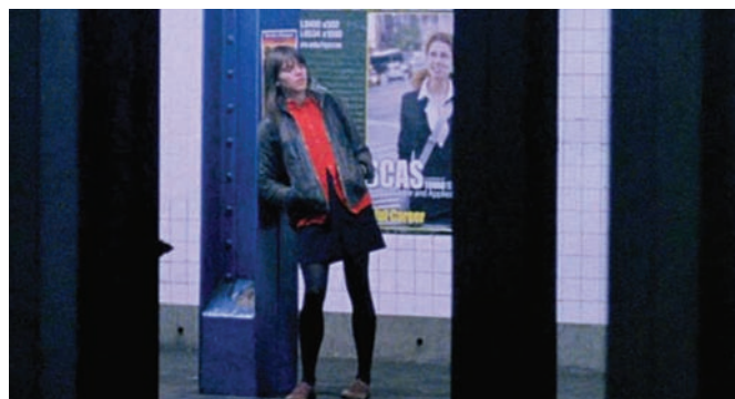
The Pleasure of Being Robbed (2008) de Joshua Safdie

Si New York n'est jamais vraiment nommé dans The Pleasure of Being Robbed (Joshua Safdie, 2008), la ville apparaît pourtant comme centrale dès les premières secondes du film. Les rues et ruelles de Manhattan sont omniprésentes dans ce film qui met en scène une jeune femme insaisissable (Eléonore Hendricks) qui vole au hasard les gens autour d'elle. Le film s'affiche comme une réflexion sur la vie privée, voire sur l'intimité impossible dans un milieu urbain. À quoi peut renvoyer le concept de propriété pour la génération MySpace? L'anonymat urbain est-il nécessairement synonyme de solitude? Eléonore est foncièrement dérangeante, justement parce qu'elle fait fi de toute règle sociale et sabote constamment l'ordre en place. Chez elle, on ne retrouve pourtant pas de mauvaise intention qui pourrait