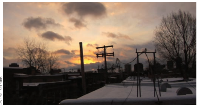
Les Prof. Box Films La fille de Montréal (2010) de Jeanne Crépeau