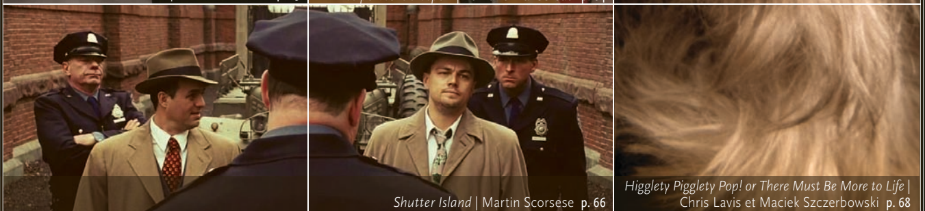
Shutter Island | Martin Scorsese p. 66