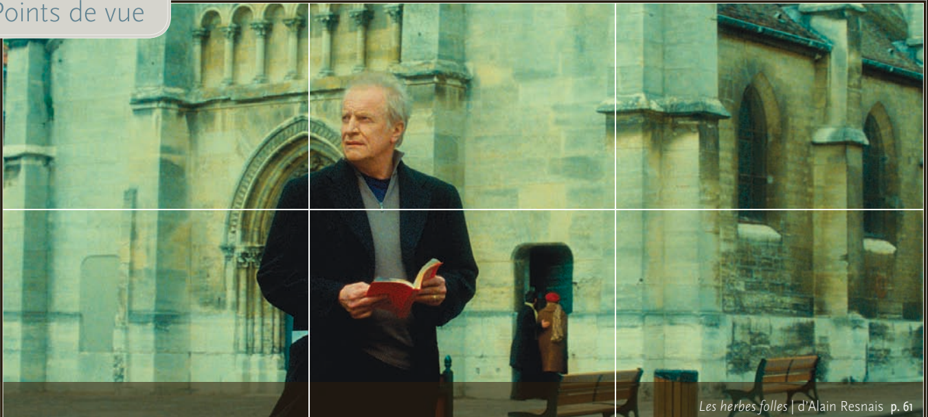
Les herbes folles | d'Alain Resnais p. 61