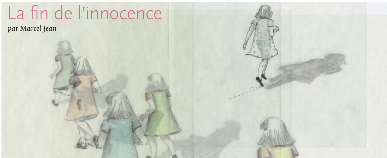
Office national du film du Canada

Dans son premier film, Marie-Hélène Turcotte parvient à approcher – à saisir même – ce moment où l'insouciance du temps des jeux laisse place à la conscience du corps, le sien propre comme celui des autres. De façon intuitive et lyrique, privilégiant l'évocation à la narration, la jeune cinéaste réussit le tour de force de doter son film d'assises tangibles – physiques, spatiales – qui agissent comme des passerelles pour l'émotion, celle-ci étant étonnamment dense s'agissant d'un dessin animé dont la logique du récit, allégorique, n'est soumise ni à la représentation réaliste, ni à la psychologie classique.