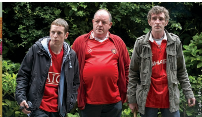
Deux des six films présentés par Wild Bunch en sélection officielle à Cannes en 2009, The Time That Remains d'Elia Suleiman et Looking for Eric de Ken Loach