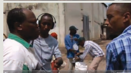
Jour 1 : Sommeil de satin Jour 12 : Give me one hundred Jour 30 : Distribution alimentaire, Afrique