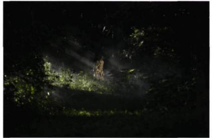
In the Electric Mist de Bertrand Tavernier

Ainsi la nature, dans le film criminel, prend-elle en charge la fatalité tragique qui est consubstantielle au genre. Un beau moment de Public Enemies (Michael Mann, 2009), c'est celui où la voiture qui emporte Dillinger et ses complices vers leur planque glisse