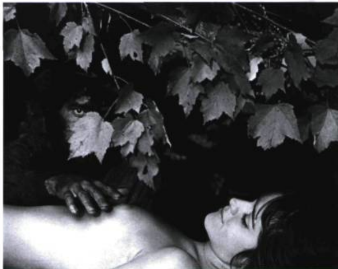
Les mâles (1970) de Gilles Carle

Réalisé par Claude Gagnon en 1985, Visage pâle s'inscrit dans la mouvance de Red . En fait, le film peut d'une certaine façon faire penser à Deliverance , classique de John Boorman. Il s'en distingue cependant sur le plan idéologique, car alors que Boorman opposait la civilisation à la sauvagerie primitive et plaçait les hommes civilisés devant la nécessité de régresser pour survivre, Gagnon introduit un troisième élément, l'Amérindien, individu capable d'évoluer harmonieusement avec la nature en canalisant sa violence et son agressivité. Ainsi, CH, le personnage principal du film, apparaît comme un séducteur fuyant les responsabilités qui, par son refus du modèle social dominant (la famille), se place en situation de vulnérabilité face à la sauvagerie qu'incarnent trois campagnards. Son expérience de la violence devient alors une sorte de traversée du désert, une expiation menant à la rencontre de l'Amérindienne Marie, figure féminine avec qui il peut apprendre à former une cellule sociale, en pleine nature. Mais, comme Réginald Mackenzie dans Red , CH réalise qu'il ne pourra toujours vivre caché.