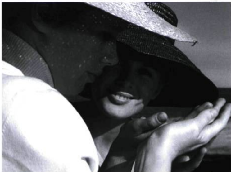
Persona d'Ingmar Bergman

Trois films des années 1950 utiliseront beaucoup plus explicitement la mer comme cadre, aussi bien que comme lieu symbolique : Jeux d'été (1950), porté par l'interprétation troublante de Maj-Britt Nilsson, présente la nature comme idéal nostalgique (la mer, immense utérus) où la liberté des corps et la force du désir se découvrent et s'affirment; dans L'attente des femmes (1952), la nature ouvre le film (eau, forêt, chalet, bain) et, ultimement, symbole d'harmonie, permet les réconciliations les plus improbables – le symbolisme convenu (eau=sexe) est par contre assez plat et n'ajoute rien au récit, non plus qu'à l'art du cinéaste; enfin, l'extraordinaire Monika (1952) reprend tous ces thèmes et les porte à un degré d'incantation jusqu'alors impensable. Premier chef-d'œuvre absolu du cinéaste, la nature est d'abord ici le corps de Harriet Andersson, et avec lui le soleil et la mer faits pour ce corps filmé avec une sensualité incomparable.