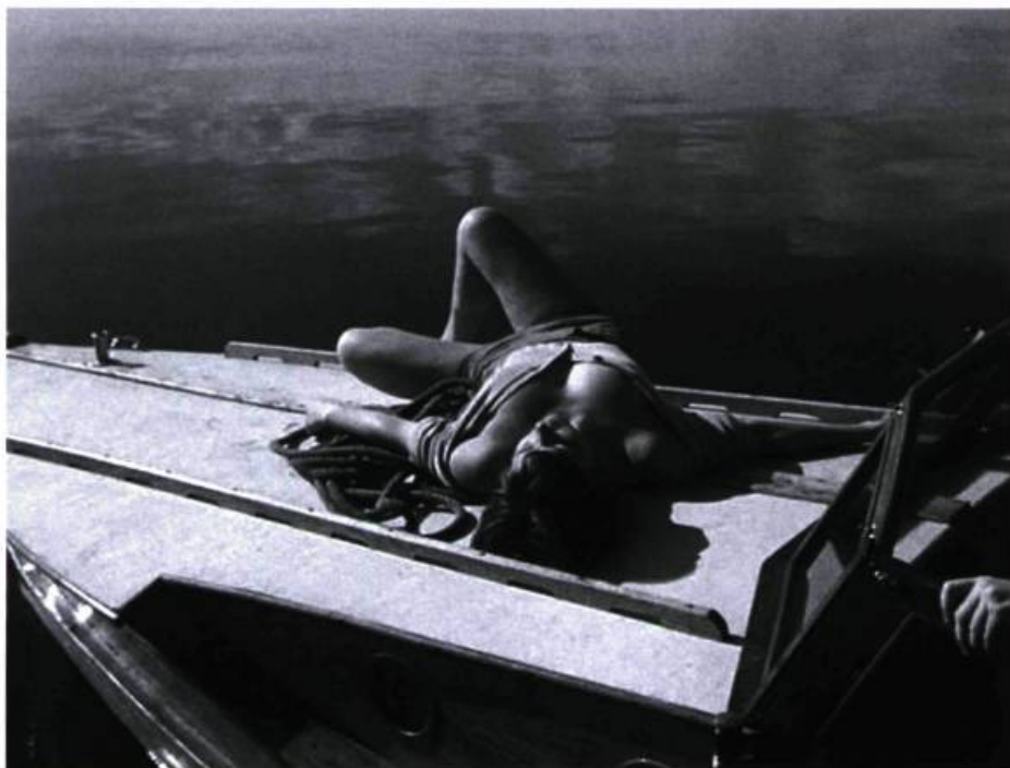
Monika d'Ingmar Bergman

HOMME DE THÉÂTRE HABITUÉ AUX ESPACES CLOS, INGMAR BERGMAN A BEAUCOUP utilisé la nature dans ses œuvres de cinéma. Comme pour la majorité des Suédois, la nature, pour lui, c'est d'abord la mer, et surtout la mer domestiquée de l'archipel de Stockholm.