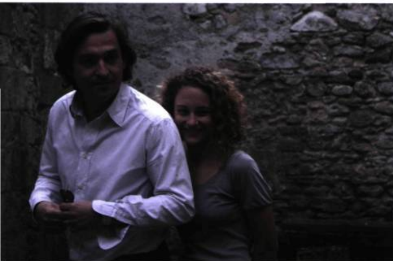
Le père de mes enfants de Mia Hansen-Love

Les hasards des sélections cannoises mettaient cette année en présence deux films que tout invite à comparer et que pourtant tout oppose. Si loin, si proche... Axelle Ropert signait avec La famille Wolberg une comédie dramatique anti-naturaliste, quatre ans après Étoile violette , moyen métrage très prometteur également présenté à la Quinzaine des réalisateurs en 2005. Mia Hansen-Love, quant à elle, proposait dans la section Un certain regard un drame réaliste, Le père de mes enfants , son deuxième long métrage ( Tout est pardonné , son premier long métrage, avait été sélectionné à la Quinzaine des réalisateurs en 2007). Deux traitements, deux esthétiques donc, pour deux films pour le moins différents... mais qui partagent curieusement une même prémisse : la « maladie » d'un père en apparence solide comme le roc vient bouleverser l'équilibre familial.