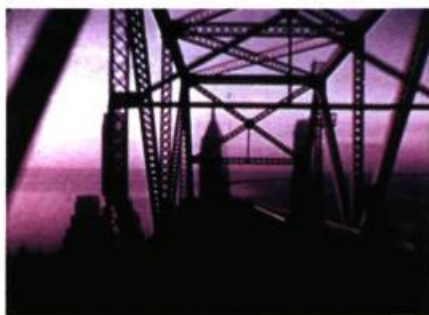
Bridges-Go-Round de Shirley Clarke