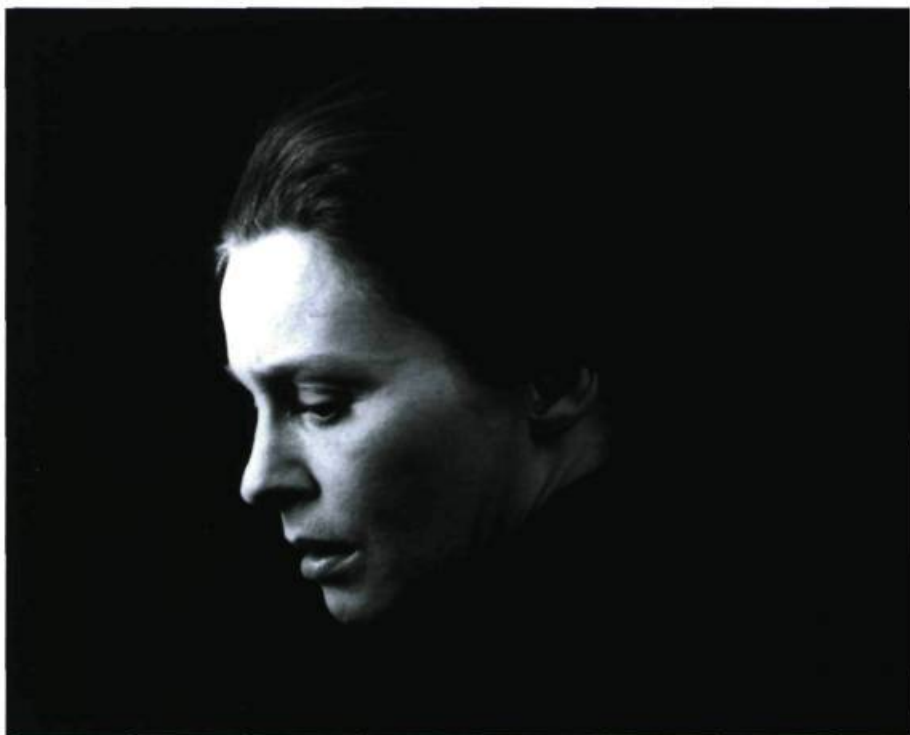
Cris et chuchotements (1972) d'Ingmar Bergman

Je suis né l'année de la mort de Gérard Philipe, à qui ma mère vouait une grande admiration (comme à Jouvet, celui du bon Knock de Jules Romains). Je me souviens encore de ma stupéfaction, il y a bien 20 ans, lorsqu'un étudiant, dans un de mes cours, voyant sur la couverture de mon édition du roman Le rouge et le noir une