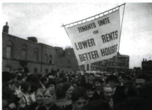
Housing Problems (1935) de Arthur Elton et Edgar Anstey et Land of Promise (1946) de Paul Rotha

Injustement oubliée, dénigrée même par certains, la production documentaire constitue sans doute la contribution la plus originale de la Grande-Bretagne à l'histoire mondiale du cinéma. Compte tenu du rôle déterminant de John Grierson, figure de proue du mouvement, dans la création de l'Office national du film du Canada, revoir ces films est aussi une façon de repenser l'histoire de l'ONF et des positions théoriques et philosophiques qui ont présidé aux premières années de son existence.