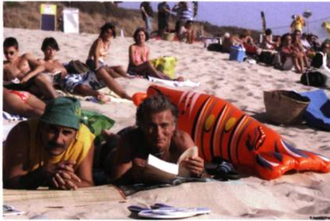
Camping (2006) de Fabien Onteniente