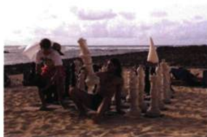
Forgetting Sarah Marshall