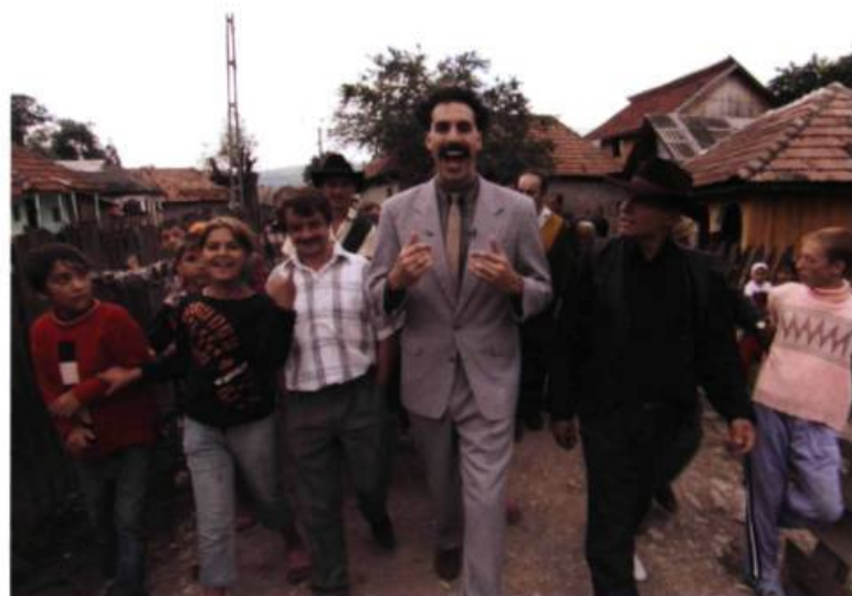
Borat: Cultural Learnings of America for Make Benefit Glorious Nation of Kazakhstan