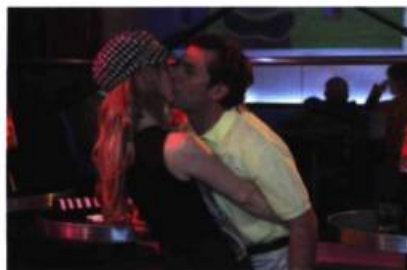
The 40-Year-Old Virgin