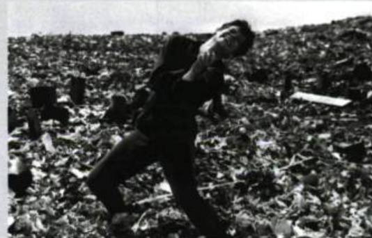
Cendres et diamant (1958)