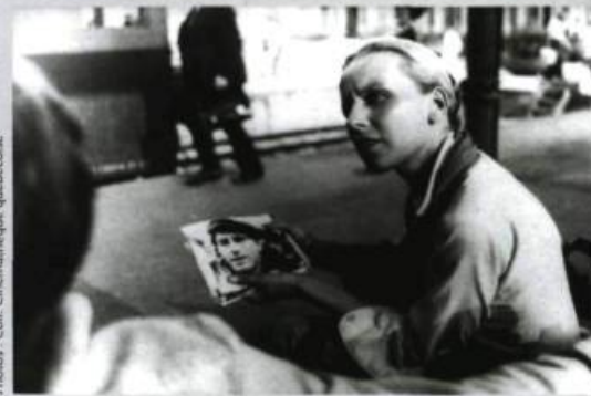
L'homme de marbre (1976)