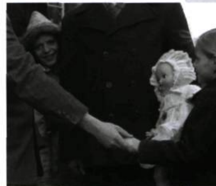
The Fifth Province