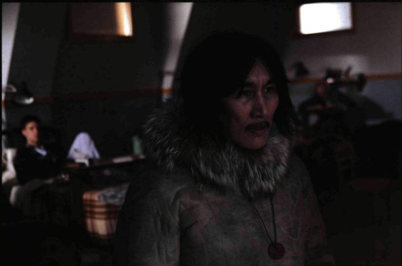
Natar Ungalaaq, dans le rôle de Tivii