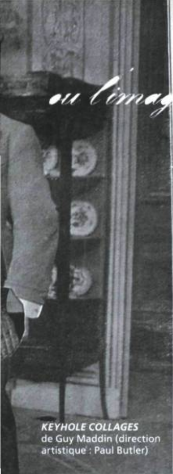
KEYHOLE COLLAGES de Guy Maddin (direction artistique : Paul Butler)