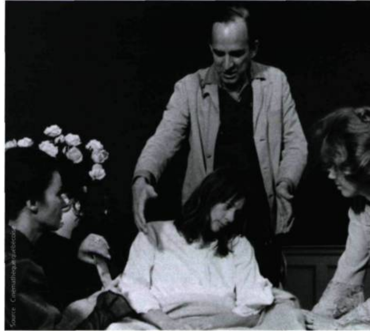
Tournage de Cris et chuchotements (1972) de Bergman

Film de fin de carrière, Identification d'une femme (1982) prend ainsi une tournure presque autobiographique. Comment, en effet, ne