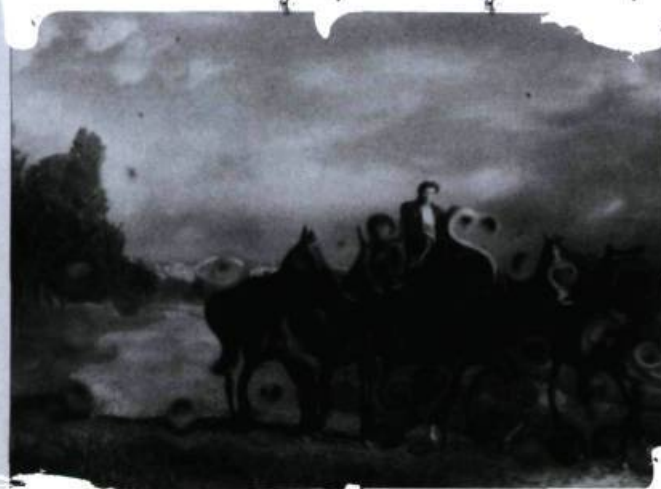
Au bord du lac