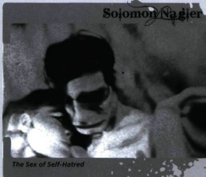
The Sex of Self-Hatred

Pour en savoir plus : www.canyoncinema.com/M/Muller.html ou encore www.fdk-berlin.de/en/arsenal-experimental/artists/matthias-mueller.html .