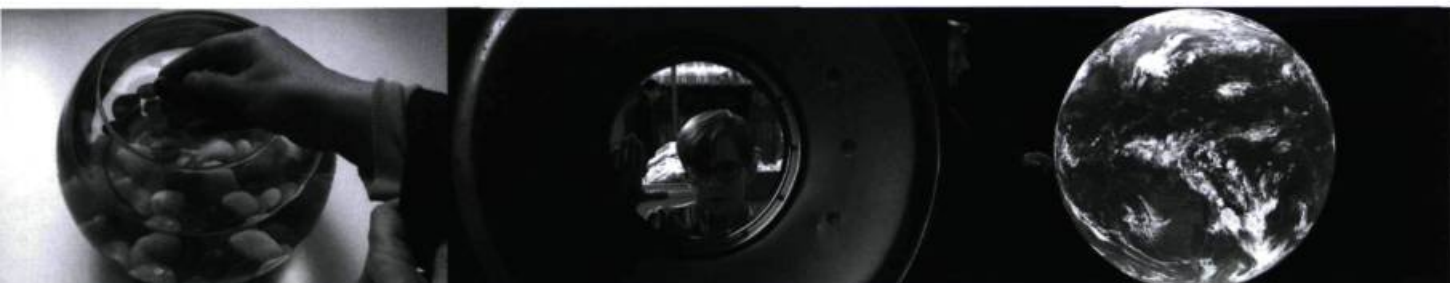
Le confessionnal (1995) et La face cachée de la lune (2003) de Robert Lepage

Sources : Pier Paolo Pasolini, Lettres luthériennes , Éd. du Seuil, 2000 (trad. française). Jean Baudrillard, Le système des objets , Éd. Gallimard, 1968.