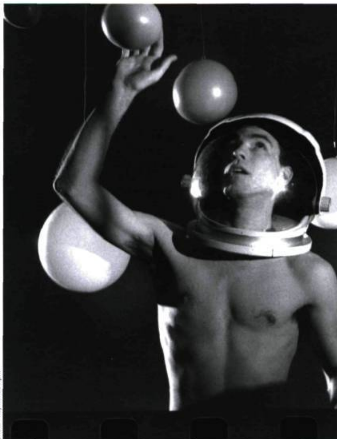
Yanik Saint-Germain dans Rien ne t'aura, mon cœur (1997)

1 Merci à Émile Nelligan pour son poème La romance du vin .