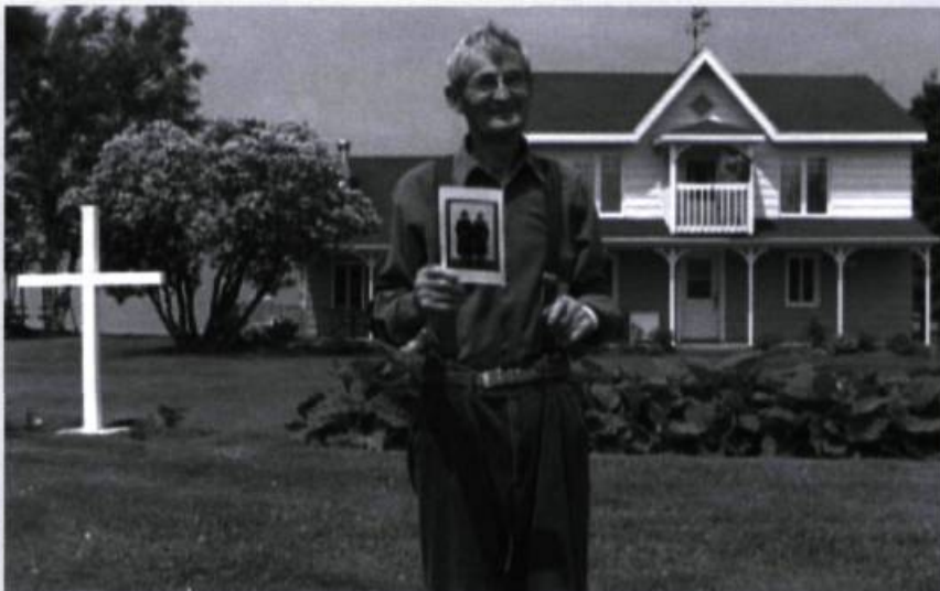
L'esprit des lieux