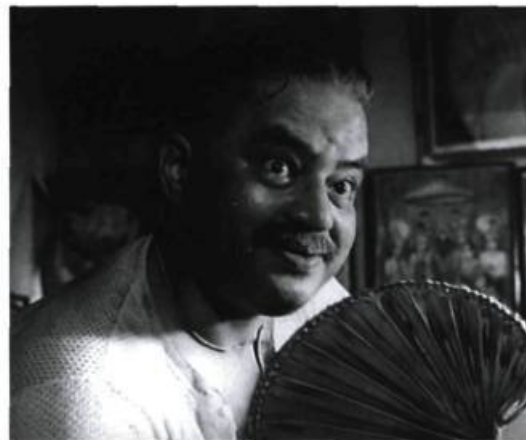
Abhijan de Satyajit Ray

Mais c'est à l'éditeur anglais Eureka que l'on doit, pour finir, la plus inoubliable séance de rattrapage. Grâce à lui, on peut en effet découvrir Abhijan ( The Expedition , 1962), l'un des films les moins célèbres de Satyajit Ray, et pourtant l'un de ses plus beaux. Précisons d'emblée qu'il s'agit bien d'un DVD « all zone » (qui plus est au format NTSC), contrairement à ce qui est indiqué sur les sites de vente Internet (par exemple www.cdwow.com où il peut être commandé sans frais de port). C'est ici le triomphe de la sensibilité et de l'instinct. Travelling, panoramique, zoom, caméra à l'épaule, plan fixe, plans-séquences, contre-plongée : de tous les grands cinéastes, Ray est assurément celui dont le style est le plus imprévisible et le moins dogmatique en ce qu'il ne se refuse à utiliser aucune technique pour donner à chaque scène l'émotion (souvent fébrile) qui lui convient. Ainsi le lyrisme de ses films est comme contenu dans les moyens qu'il utilise. De ce point de vue, Abhijan est une œuvre vibrante, capable de nous bouleverser indépendamment de l'histoire qu'elle raconte. Par cette façon d'y filmer le regard des personnages, d'en faire le cœur narratif de chaque séquence (jusqu'au bout, jusqu'à ce dernier plan sur les yeux de Joseph qui porte soudainement le devenir du film), d'y filmer le paysage (telle route de campagne ou telle scène nocturne au milieu des grands rochers, dont l'étonnante splendeur ne paraît