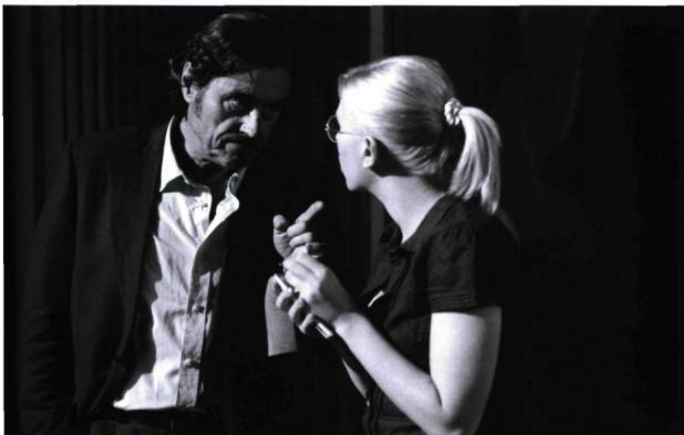
Scoop de Woody Allen enregistre cette place devenue fantôme qu'occupaient jadis les femmes du cinéastes.