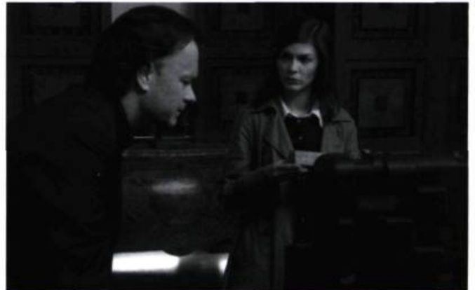
The Da Vinci Code de Ron Howard

sités – les blockbusters états-unien, bien entendu, plus un certain nombre de produits-vedettes nationaux, conçus dans l'esprit de concurrencer Hollywood –, l'immense majorité de la production mondiale compte sur des restes épars, et existe pour cette raison dans des réseaux parallèles qui possèdent leurs propres haut-parleurs promotionnels. Le circuit des festivals (avec en tête Cannes, Berlin, Venise, mais aussi Toronto, Sundance, Montréal, etc.) et sa distribution annuelle de bonnes notes constituent à