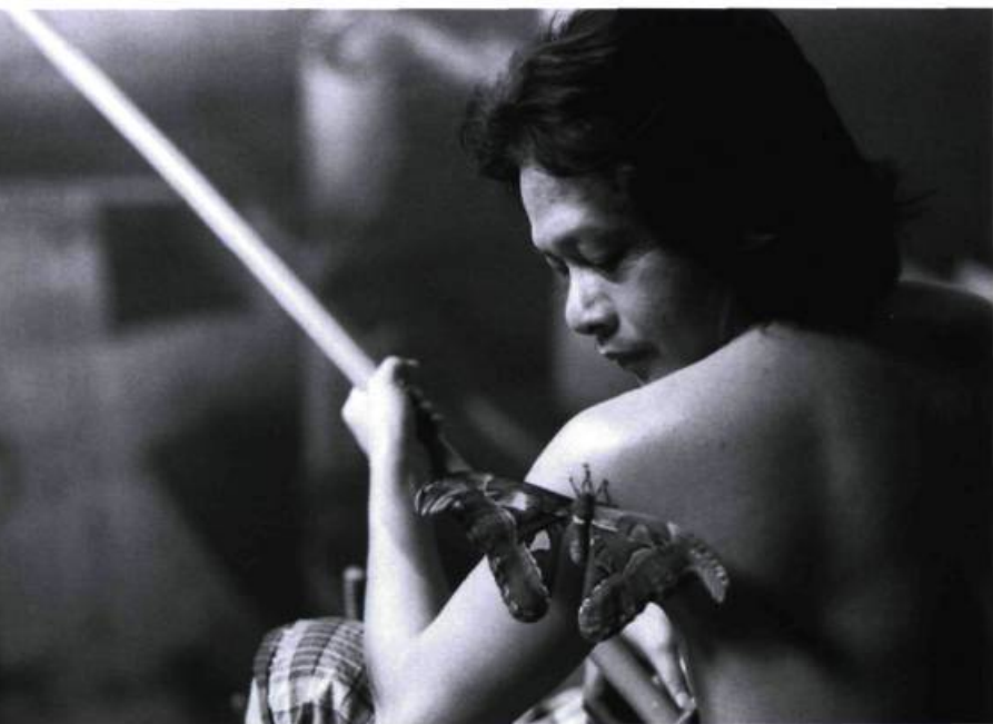
I Don't Want to Sleep Alone apparaît comme la somme de toute l'œuvre de Tsai Ming-liang.