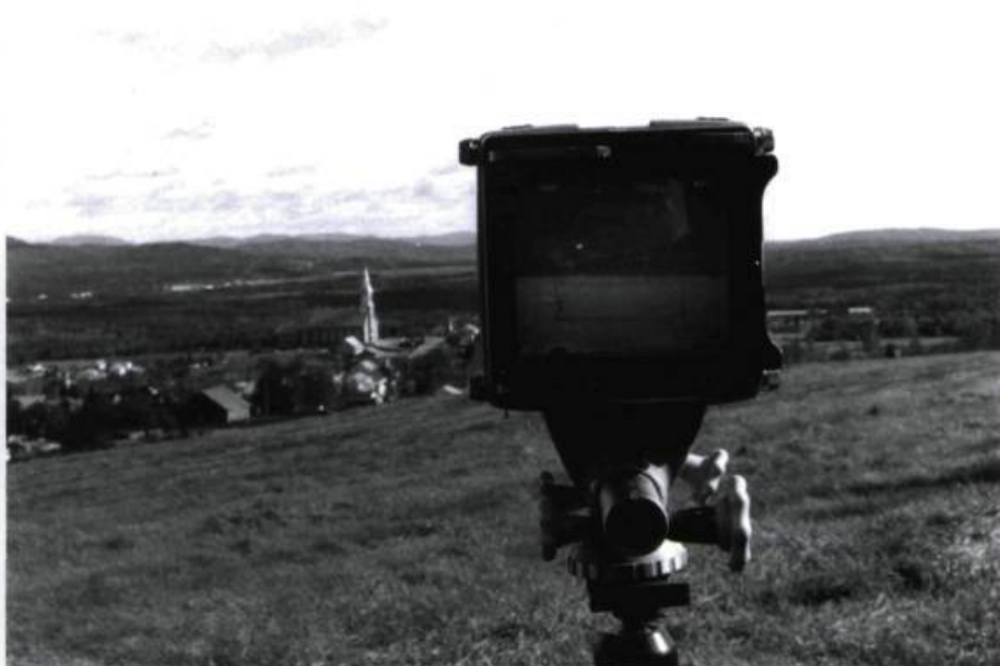
L'esprit des lieux de Catherine Martin

La plupart des films ci-haut mentionnés ont été tournés sans film, sur support vidéo. Et il faut bien reconnaître que la qualité des images produites est la plupart du temps d'une grande qualité, pour ne pas dire davantage (mis à part le laborieux La vie est une goutte suspendue du cinéaste franco-iranien Hormuz Kez, exemple limite de ce qu'une petite caméra numérique peut provoquer comme délire). Exception remarquable, un très attachant film italien d'Anna Buchetti. Dreaming by Numbers est le plus classique des films de cette sélection : cinéma direct traditionnel, par ses moyens techniques (16 mm noir et blanc, caméra légère) aussi bien que par son sujet (un comptoir de loterie dans un quartier populaire de Naples), c'est une sorte d'objet néoréaliste avec des personnages bien dessinés, une cinéaste en parfaite complicité