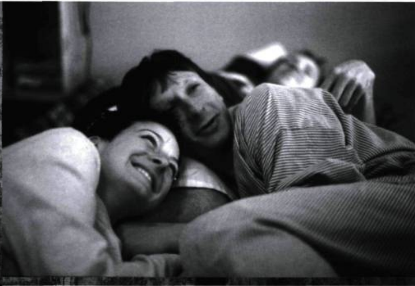
La moitié gauche du frigo

Vous montrez bien l'importance de la filiation personnelle comme thème central de votre film, mais il me semble qu'en choisissant d'ancrer cette histoire dans deux contextes nationaux différents, vous y ajoutez une dimension politique.