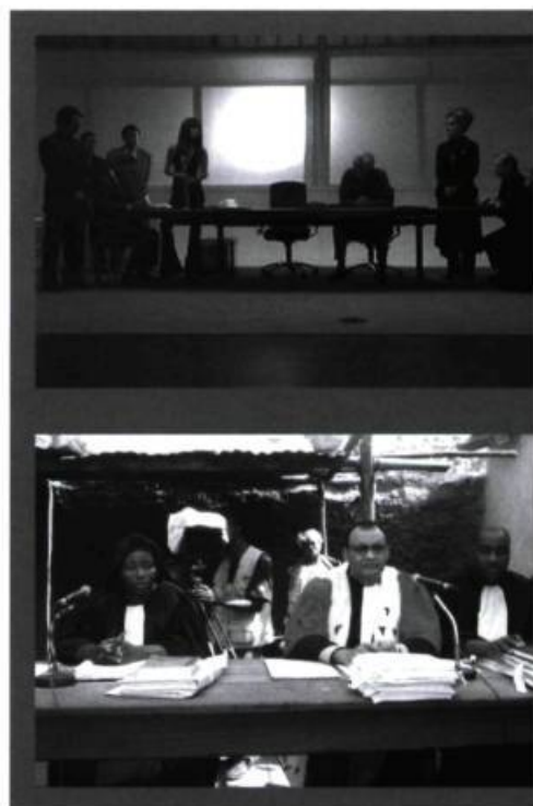
Southland Tales de Richard Kelly et Bamako d'Abderrahmane Sissako.