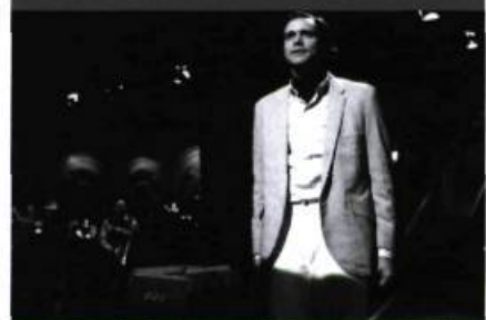
Man on the Moon (Milos Forman, 1999)

Parmi les genres qui dominent la production américaine, le « biopic » est un objet d'analyse négligé et pourtant révélateur de l'idéologie individualiste qui détermine le fonctionnement du cinéma hollywoodien. Avec The People vs Larry Flint et Man on the Moon , Milos Forman s'est fait l'avocat de deux personnalités d'exception, deux destins marqués par une insatiable soif de liberté s'exprimant de la manière la plus dionysiaque qu'on puisse imaginer. Avec son ego surdimensionné, son mépris des règles établies et sa profonde originalité, Andy Kaufman, le héros de Man on the Moon , est une pure créature des États-Unis. Ce film fait la preuve, près de 28 ans après Taking Off , que Milos Forman demeure un observateur pertinent de la société américaine. – M.J.