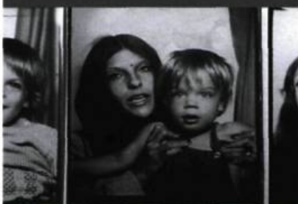
Tarnation (Jonathan Caouette, 2003)

Filmé avec un budget dérisoire par un « ange nucléaire », un Petit Prince de l'underground,