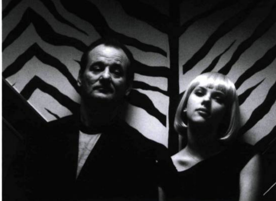
Lost in Translation (Sofia Coppola, 2003)

Étrange amitié que celle qui se noue, dans un hôtel de Tokyo, entre une jeune mariée mélancolique (S. Johansson) et un acteur déprimé (B. Murray) venu tourner une publicité. Tous deux devenus insomniaques à force de solitude intérieure (chacun souffrant à sa manière d'une certaine indifférence de son entourage, elle de son mari, lui de sa femme), ils parviennent à s'offrir l'un à l'autre une forme de compréhension instinctive. La force du scénario est d'être parvenu à décrire cette reconnaissance mutuelle dans le non-dit, sans discours pleurnichard sur ce qui les accable dans leur vie personnelle. Sofia Coppola, brillamment, superpose ainsi la vie de l'un à celle de l'autre... Murray nous fera comprendre qu'il