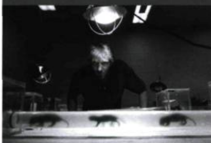
Fast, Cheap and Out of Control (Errol Morris, 1997)

Morris au sommet de son art. Documentaire pour grand écran s'il en fut jamais un, le film est une sorte de célébration éclatée de l'intelligence humaine. Par les portraits croisés de quatre individus hors du commun (un dompteur de lions, un jardinier-sculpteur, un créateur de robots et un spécialiste du rat-taupe d'Afrique du Sud), le cinéaste nous propose un essai philosophique qui est aussi une aventure plastique de toute beauté. – R.D.