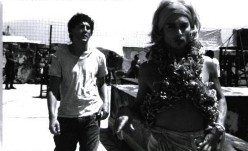
Before Night Falls (Julian Schnabel, 2000)

Après son premier long métrage, Basquiat , le réalisateur et peintre new-yorkais Julian Schnabel revient à la biographie d'artiste, cette fois celle de l'écrivain-poète cubain Reinaldo Arenas. Participant très jeune à la révolution cubaine et profitant du vent de liberté des années 1950-1960, Arenas s'opposera néanmoins au régime de Castro quelques années plus tard (et à l'idée même de révolution : « Les véritables artistes sont des contre-révolutionnaires », lui aurait dit l'un de ses mentors après un discours bien senti). Vite reconnu comme écrivain, son œuvre sera mise à l'index par le gouvernement et il souffrira notamment d'une persécution homophobe et anti-intellectuelle. Surveillé, poursuivi et finalement jeté en prison sous de faux prétextes, il parviendra à s'exiler aux États-Unis avant de se suicider en 1990, affligé par le sida. La réalisation fait de Before Night Falls une œuvre extrêmement inspirée. Schnabel s'engage ici dans son sujet de manière inouïe, épousant les aspects les plus forts de la vision d'Arenas (le film est écrit d'après ses mémoires). Le tour de force de Schnabel consiste à ne jamais nous faire sentir les jalons prévisibles de la reconstitution historique et biographique, s'attardant davantage à évoquer la perception poétique de l'écrivain. Le mariage de l'œuvre d'Arenas et du film de Schnabel nous plonge ainsi dans un véritable état de grâce. – S.G.