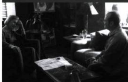
The Pledge (Sean Penn, 2001)