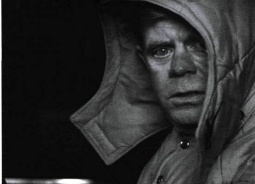
Fargo (Joel Coen, 1996)