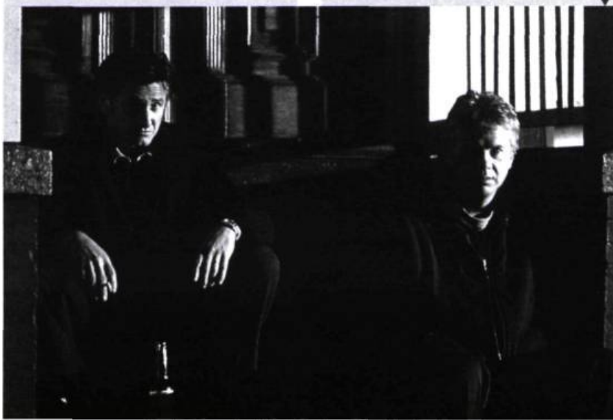
Mystic River (Clint Eastwood, 2003)

Brillante illustration de la chance et du hasard, sur la base du jeu des probabilités à l'œuvre au cours d'un match de tennis, avec son retournement diabolique en fin de parcours, ce « drame » jouissif librement inspiré de Crime et châtiment se tient constamment sur la corde raide de l'humour discret en se jouant des clichés, afin de broser un portrait de société caustique, impliquant le vertige de l'effet miroir, dans lequel la bourgeoisie anglaise en prend pour son rhume. Sa mise en scène d'une redoutable efficacité a déconcerté plus d'un critique. — G.M.