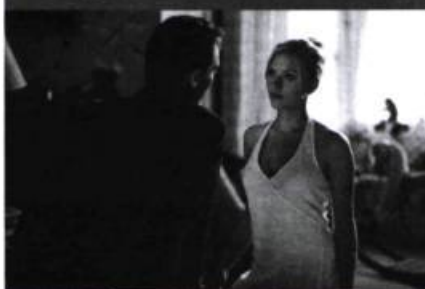
Match Point (Woody Allen, 2005)

Brillante illustration de la chance et du hasard, sur la base du jeu des probabilités à l'œuvre au cours d'un match de tennis, avec son retournement diabolique en fin de parcours, ce « drame » jouissif librement inspiré de Crime et châtiment se tient constamment sur la corde raide de l'humour discret en se jouant des clichés, afin de broser un portrait de société caustique, impliquant le vertige de l'effet miroir, dans lequel la bourgeoisie anglaise en prend pour son rhume. Sa mise en scène d'une redoutable efficacité a déconcerté plus d'un critique. — G.M.