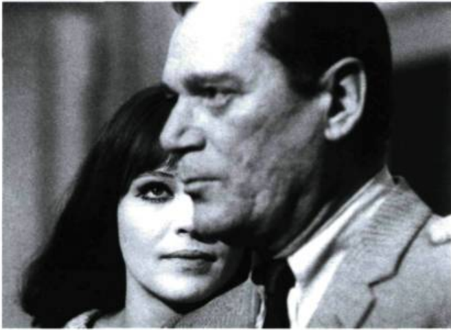
Alphaville, une étrange aventure de Lemmy Caution (1965).

porte des chapeaux d'homme, comme celui qu'Odile piquait à Sami Frey... La tragique Natacha von Braun d' Alphaville , que ne parvient même pas à éclipser la musique sublime de Paul Misraki, c'est encore elle. Et la Marianne Renoir de Pierrot le Fou , clin d'œil au peintre et au cinéaste bien sûr, incarnation nouvelle de la splendeur au féminin selon Jean et Pierre Auguste, qui joue la guerre du Vietnam devant des touristes américains et se fait son « cinéma permanent », qui a « une toute petite ligne de chance » et ne sait pas quoi faire, c'est encore et toujours Anna, frivole et farouche, coquine et libertine, Anna dont le cœur balance et dont les équilibres sont fragiles. « C'était une époque formidable que la Nouvelle Vague. On ne se prenait pas au sérieux, mais, en même temps, on faisait tout sérieusement. On travaillait dans la joie, le bonheur et l'absolue liberté. On était dans un total état d'enfance. »