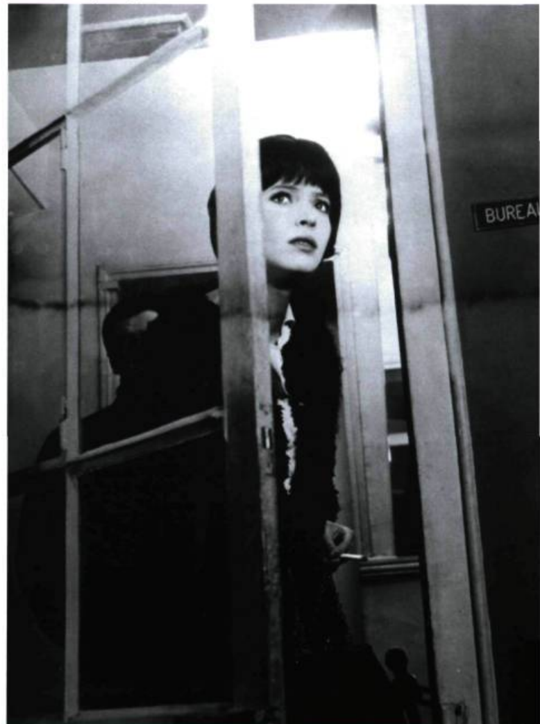
Vivre sa vie (1962).