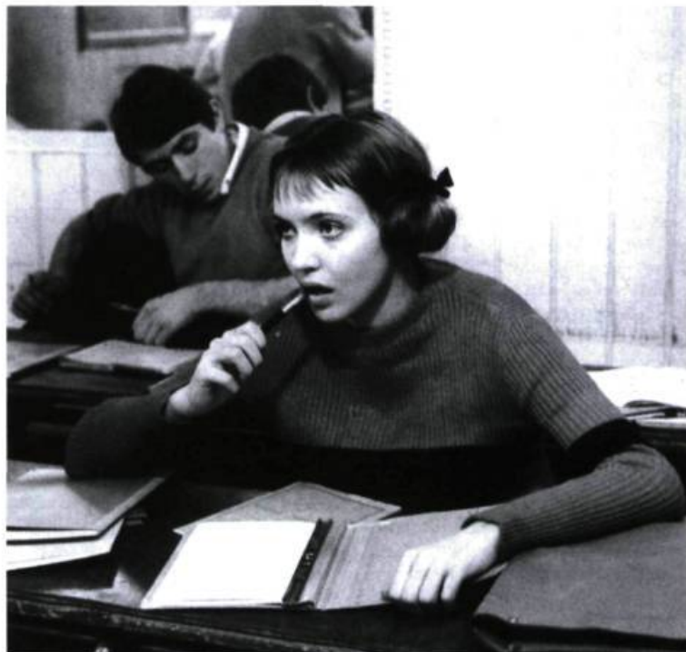
Bande à part (1964).