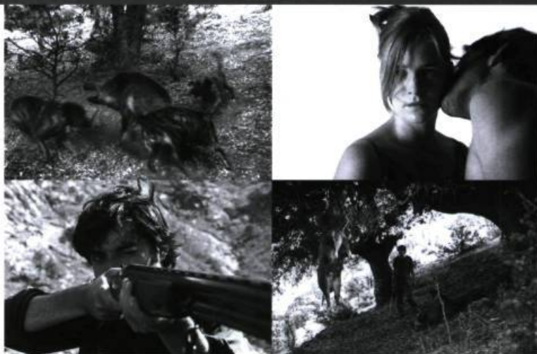
Orso Miret fait se répondre des motifs et des symboles par un jeu de miroir, de répétition.

L e silence d'Orso Miret, gagnant du Prix de la critique québécoise pour le meilleur long métrage français au 1 er Festival des films de Montréal, est une œuvre forte et habitée. Le film révèle sans contredit un caractère d'auteur qui sait jouer de l'ellipse et du non-dit sans en abuser, et affirmer sa personnalité pour mettre en valeur la dimension immédiatement symbolique d'un cadre naturel, ici la Corse, filmée avec beaucoup de sensibilité – non pas comme la carte postale habituelle de l'île de beauté , mais comme ce territoire sauvage, brut qui a imprimé aux hommes qui la peuplent son caractère âprement violent. La scène de chasse en montagne qui ouvre le film est à ce titre exemplaire puisqu'elle sert à révéler, en même temps que le décor spectaculaire où prend place le drame, la manière dont les hommes sont liés entre eux et liés au paysage , comme par une alchimie secrète que Miret réussit très bien à distiller à travers moult détails qui forment la trame souterraine de l'histoire. Il y a une qualité presque documentaire à ces images de chasse qui résonnent comme l'écho troublant d'un autre temps, plus dur, primitif même, lié au présent par la persistance des rituels, expression d'une authentique culture. C'est là la force singulière de ce film que de faire entendre dans chaque image le vibrato particulier d'un monde dont les règles en apparence obsolètes constituent le ciment social dont il ne pourrait se passer.