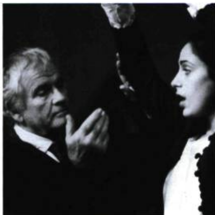
Esther Kahn (2000).