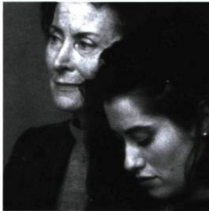
La vie des morts (1991).

Je ne connaissais pas, mais je me suis renseigné, car je ne sors pas du credo bazinien : le cinéma est un art du réel. Comment est utilisé le fait que Cary Grant soit paléontologue dans L'impossible Monsieur Bébé ? Cela fonctionne dès le premier plan et dit une vérité absolue mais je ne sais pas sur quoi. On pourrait imaginer un cadre dans une société des années rooseveltiennes, mais ça dirait deux fois moins de choses sur la comédie de l'amour. Par ailleurs, c'était passionnant de rencontrer les gens au quai d'Orsay comme les médecins de l'Institut médico-légal. Cela nourrit considérablement tandis qu'eux n'ont pas l'impression d'être ce réservoir à fictions. Je ne connaissais pas non plus le chant classique. Je suis allé à des cours voir comment ça se passe, poser des questions. Il y a là un plaisir de découverte quasi enfantin. À la sortie de Comment je me suis disputé... (ma vie sexuelle) , on m'a taxé d'intellectuel, imaginant que je décrivais un monde qui m'était familier. Or, pendant l'écriture du film, nous ne savions pas quelle serait l'activité de nos personnages. Nous avons arrêté trois possibilités et affiché les douze scènes à remplacer pour le cas où nous changerions le métier du personnage in extremis . Il est arrivé un moment où ce n'était plus