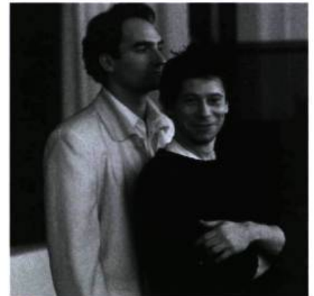
Comment je me suis disputé... (ma vie sexuelle) (1996).

différentes formes de musique. Certaines compositions peuvent sembler un peu rébarbatives au début, mais une fois qu'on les connaît, on découvre leurs très grandes beautés. Pour les films d'époque, il y a des cas où il peut être pertinent que la tonalité musicale colle au moment de l'histoire, mais il est ridicule d'en faire un système. Connaissant le travail d'Howard Shore, je savais qu'il n'avait fait aucune musique d'époque. Me souvenant que les compositeurs qui l'avaient influencé étaient les Américains des années vingt et trente, je l'ai rassuré : il n'était pas obligé de pasticher une musique ancienne comme on le fait pour les téléfilms. Il pouvait écrire une composition moderne, les spectateurs savent bien que le film n'a pas été tourné à une époque où le cinéma n'existait pas.