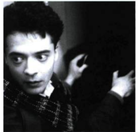
La sentinelle (1992).