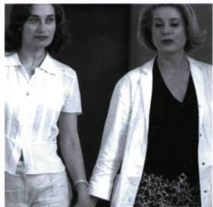
Rois et Reine (2004).